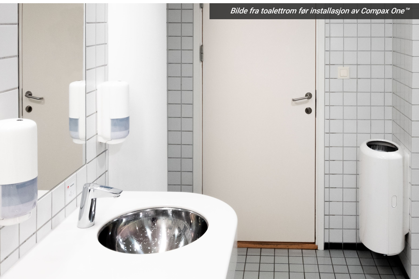
Bilde fra toalettrom før installasjon av Compax One™

Det siste toalettrommet finnes i et kontorområde. Her var det opprinnelig installert en mindre avfallsbeholder hvor posen byttes daglig.