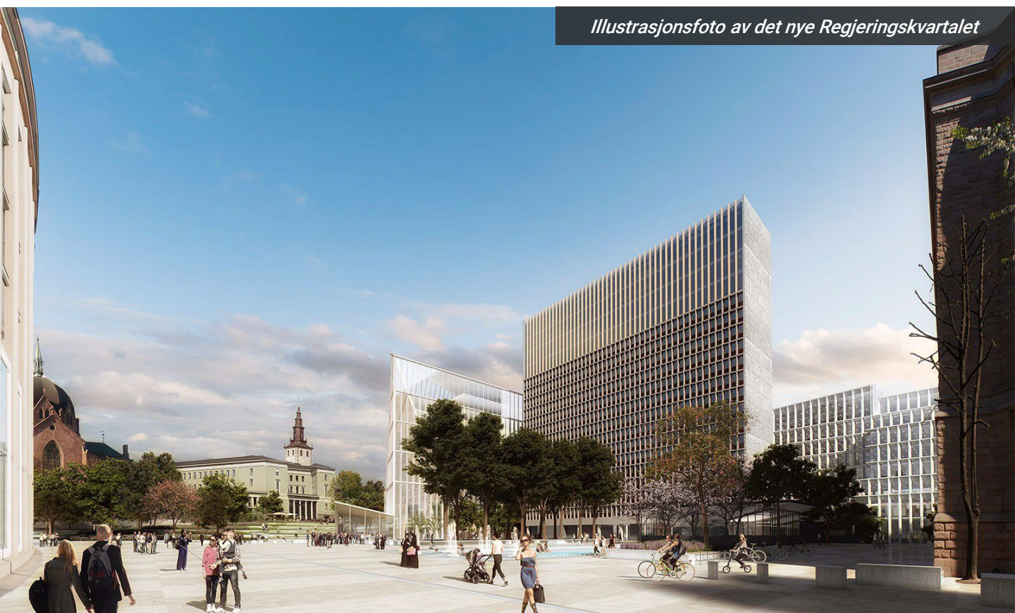
Illustrasjonsfoto av det nye Regjeringskvartalet