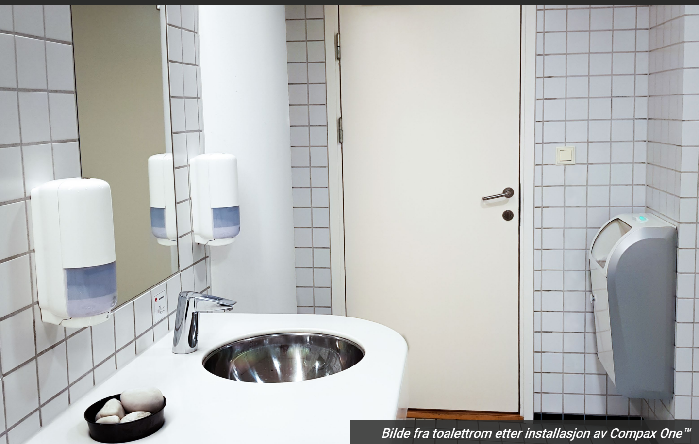
Bilde fra toalettrom etter installasjon av Compax One™